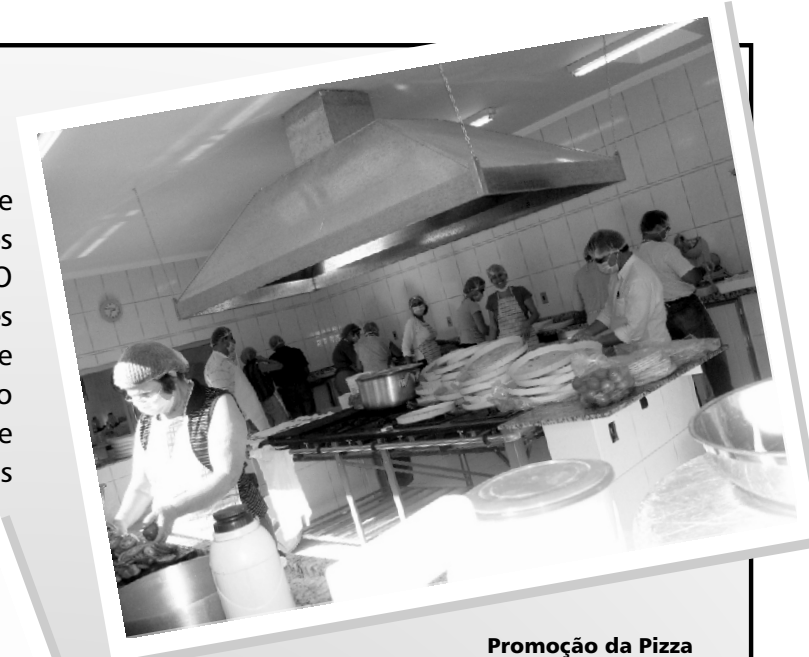
Promoção da Pizza

Objetiva a captação de recursos, mantimentos e materiais diversos para o desempenho dos projetos assistenciais e manutenção da Associação. O Departamento de Promoção promove atividades como: pedágios em supermercados, almoços e outras promoções. Visa, também, o entrosamento entre os trabalhadores da Associação. Esse departamento é composto por integrantes dos demais departamentos.