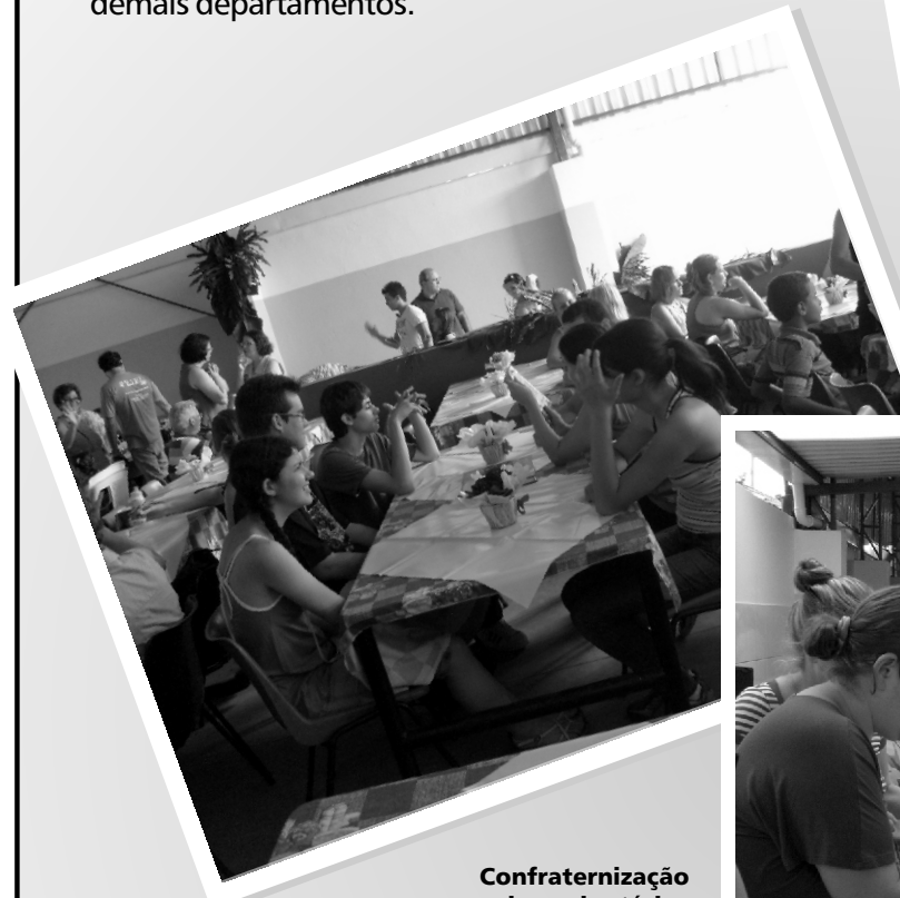
Confraternização dos voluntários da Associação