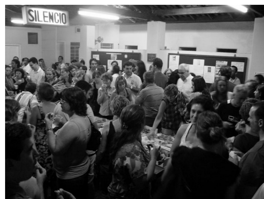
Confraternização dos cursos