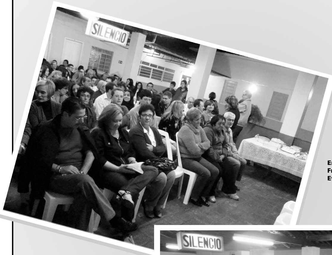
Encontro Fraterno do Evangelho

Atualmente a associação conta com 250 treinandos inscritos.